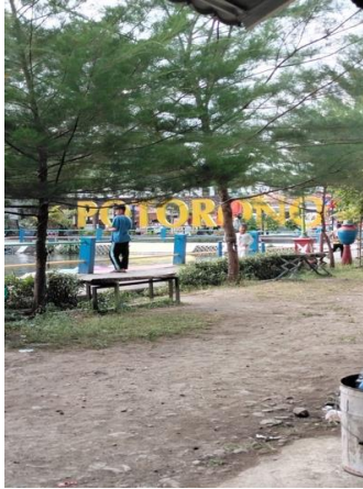
Lampiran 1. Survey Pra-Pengabdian (Survey Lokasi)