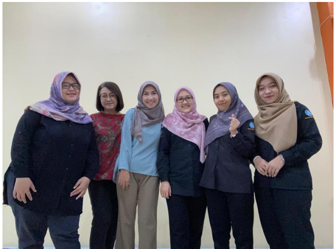
Lampiran 2. Dokumentasi Kegiatan Sarasehan